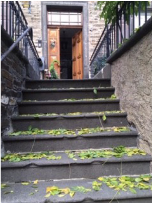
DIE GRAFIK KANN AUF DER HOMEPAGE HERUNTERGELADEN WERDEN.